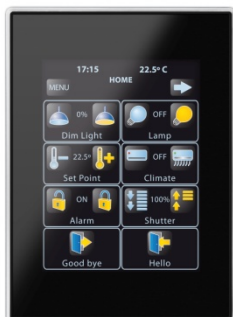
ZENNIO Z41 roomcontroller

De aangereikte oplossing en concepten van knx-homecontrol zijn gebaseerd op KNX producten van ZENNIO , ELSNER en ARCUS . De mix van deze producten laten toe om te komen tot een uitgebalanceerd , betaalbaar en comfortabel concept .