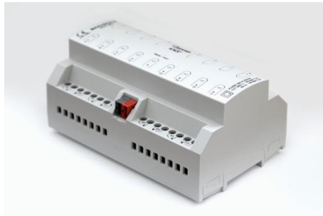
ZENNIO MAX16 KNX actionneur + logical functions