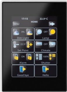
ZENNIO Z41 roomcontroller

Dû au grand choix de fabricants KNX et de milliers de produits certifiés, KNX pourrait sembler trop compliqué. KNX-homecontrol est là pour vous aider à y voir clair et apporte des solutions développées avec une fonctionnalité bien définie.